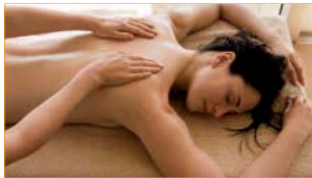
© Institut Daniel Jouvance